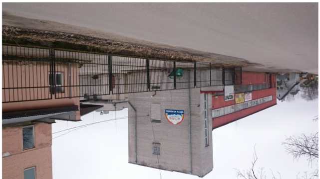
Foto 2. Vaade Suur-Jõe tänavalt.