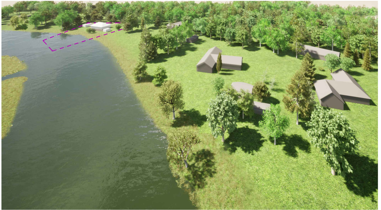
Pilt 1. Vaade planeeritavale alale loodest.