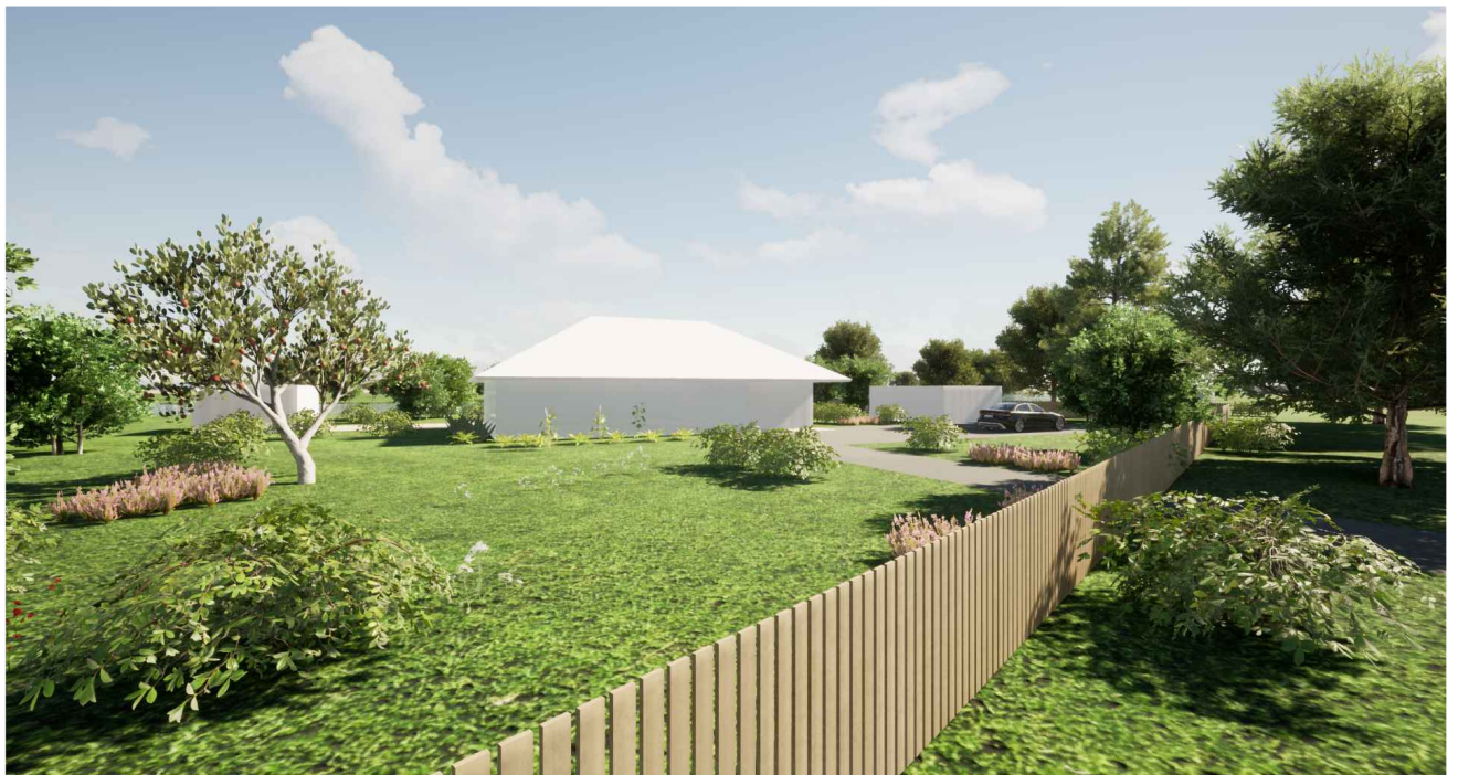
Pilt 2. Vaade planeeritavale kinnistule edelast.